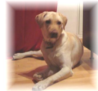
Poix, der Therapiehund